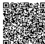
Ratgeber des BBK